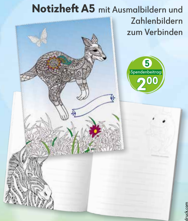
Notizheft A5 mit Ausmalbildern und Zahlenbildern zum Verbinden