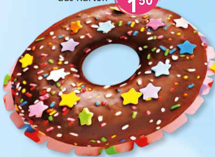
Frisbee aus Karton