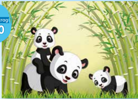
Pandakarte mit Hochprägung